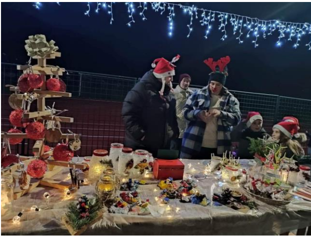
Učence na razredni stopnji je obiskal dedek Mraz.