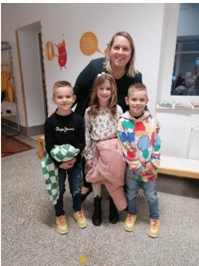
Učenci 5.a in 5.c so odšli v ČŠOD Rak.