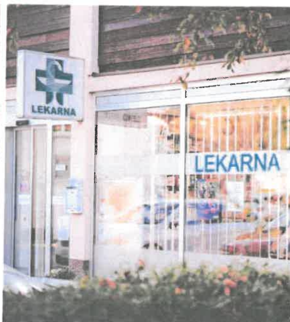
Fotografiji: Lekarniška podružnica Izlake