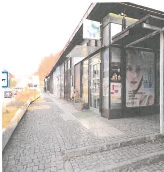
Fotografiji: Lekarna Center