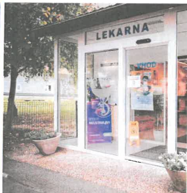
Fotografiji: Lekarniška podružnica Dol pri Hrastniku