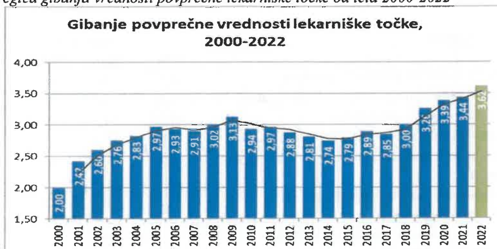
Graf 2: Pregled gibanja vrednosti povprečne lekarniške točke od leta 2000-2022

Sprememba vrednosti točke se je še vedno nanašala na sprejetje Dogovora o ukrepih na področju plač in drugih stroškov dela v javnem sektorju za leti 2022 in 2023 (Uradni list RS, št. 136/2022, z dne 25.10.2022) ter pripadajočih aneksov h kolektivnim pogodbam, med njimi tudi h Kolektivni pogodbi za dejavnost zdravstva in socialnega varstva (objavljen v istem Uradnem listu RS). Tokratna sprememba se je nanašala na popravek izračuna višine regresa v kalkulativnih elementih točke, saj je bilo po objavi vrednosti točke za mesec november 2022 ugotovljeno, da je ZZS v izračunu upošteval neto znesek namesto obdavčenega zneska, kakor izhaja iz pojasnil MJU , z dne 28.10.2022, št. 0100-533/2022/1. Namreč pri izplačilu regresa je potrebna obdavčitev zneskov, saj zneskov poračunov regresov ni mogoče vsebinsko opredeliti pod regres in se posledično ta poračun šteje pod druge dohodke iz delovnega razmerja. Posledično se je višina vrednosti točke s poračunom, ki je začela veljati s 1.11.2022, v mesecu decembru dodatno dvignila še za 0,21, kar pomeni, da je bila vrednost točke 4,13 namesto 3,92.